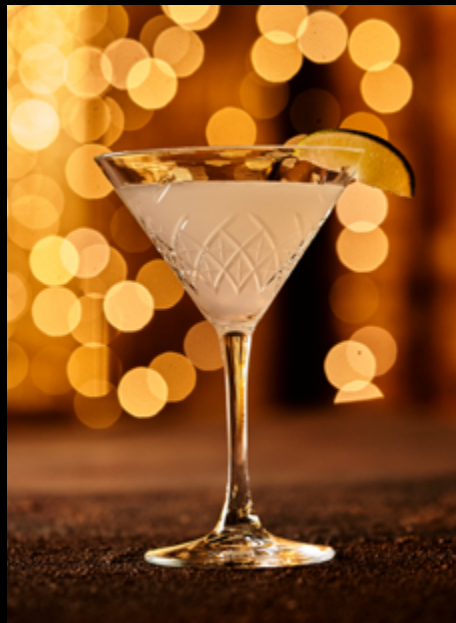
Маргарита _____ 120мл/550₽ #текила #ликёрапельсин #лайм