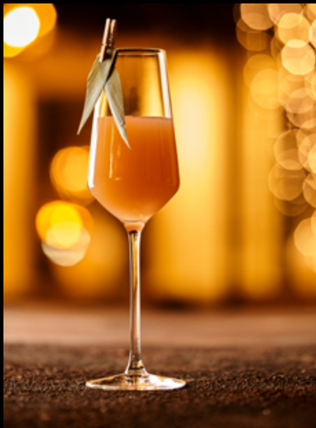
Bellini _____ 130мл/380₽ #игристое #персик #любовь