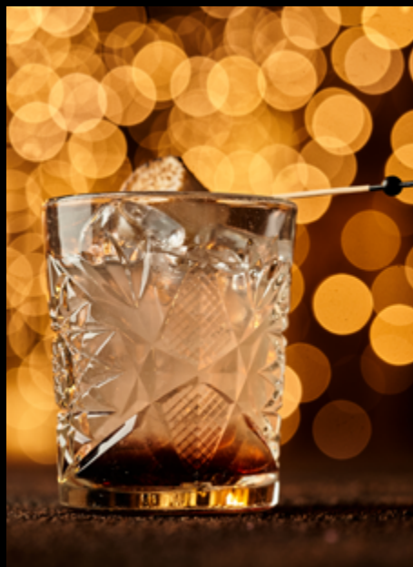
Brambl _____ 120мл/430₽