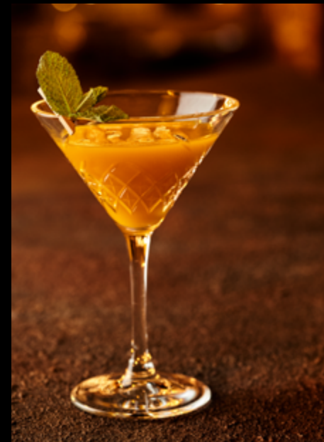
Mango Tini _____ 120мл/370₽ #манго #вермут #водка #мята