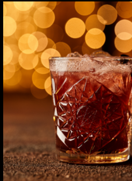
Agatha Christie _____ 120мл/440₽ #водкаваниль #кассис #лимон