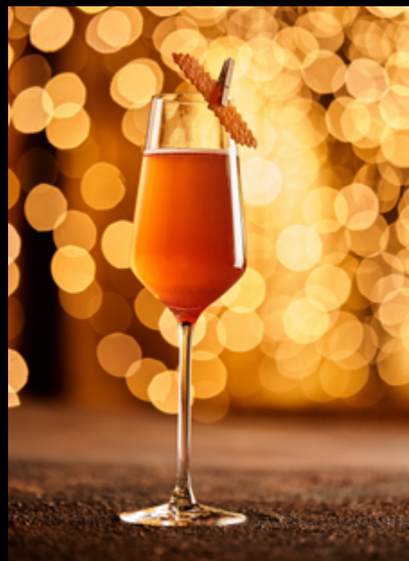
Caesar Cherry _____ 160мл/540₽