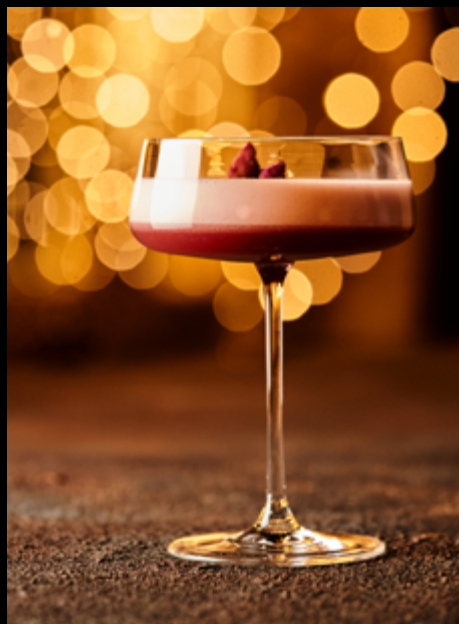
Clover Club _____ 160мл/410₽