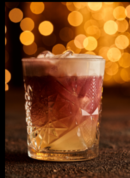
New York Sour _____ 130мл/410₽